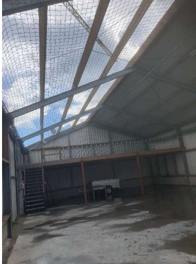
Asbest eraf bij de familie Van Soest

Om tot een goede aanbesteding te komen is van elk van de 11 dak eigenaren nadere informatie nodig. Het gaat dan bijvoorbeeld over het aantal dak-doorvoeren, het al dan niet plaatsen windveren en andere bijzonderheden per adres. Robbert van Dijk van KP Adviseurs zal daarvoor in januari 2022 contact opnemen met diegenen die een asbestonderzoek hebben laten uitvoeren, en die informatie neemt hij in de aanbesteding mee. Er worden 4 partijen uitgenodigd om een scherpe prijs te maken voor dit collectief. Op basis van de aanbesteding uitkomst (waarschijnlijk maart 2022) kunnen de dak eigenaren er voor kiezen tot asbestsanering (en mogelijk plaatsen van een nieuw dak) over te gaan.