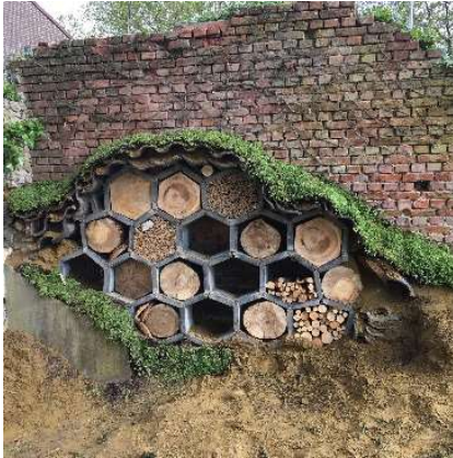
Op de excursie ontdekt